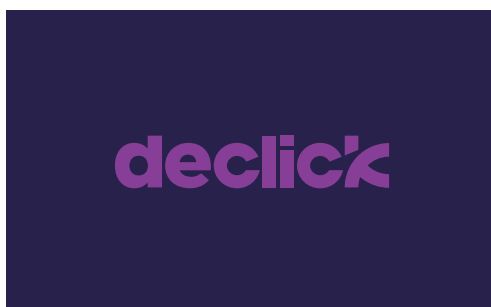
logotype declick version négative v2 couleur