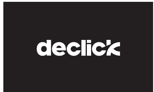
logotype declick version négative monochrome