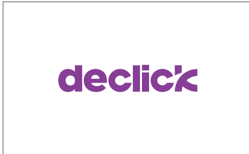
logotype declick version positive couleur