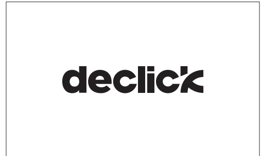
logotype declick version positive monochrome