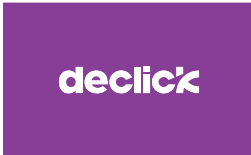
logotype declick version négative v1 couleur